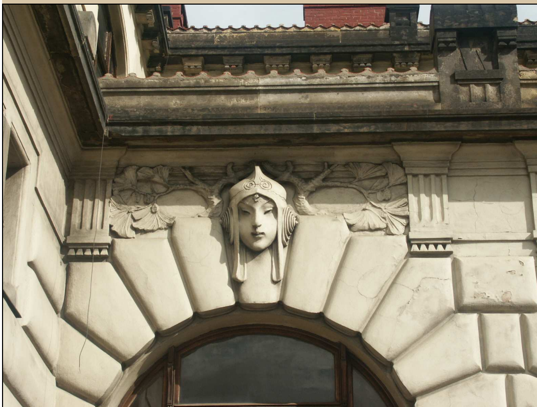
maskaron v klenáku okna stav v roce 2004