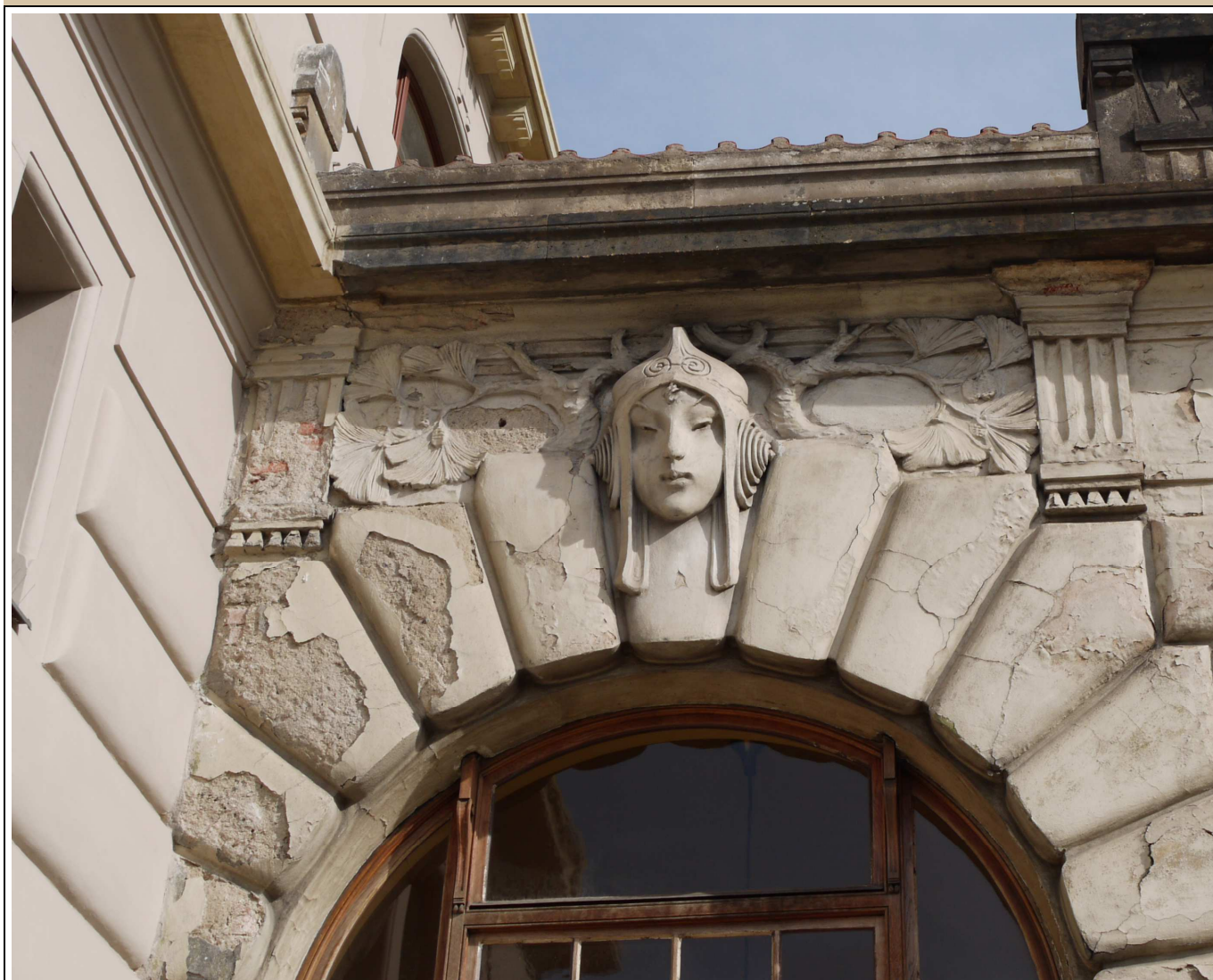
maskaron v klenáku okna stav v roce 2017